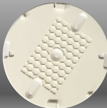
Vue de derrière et Base.